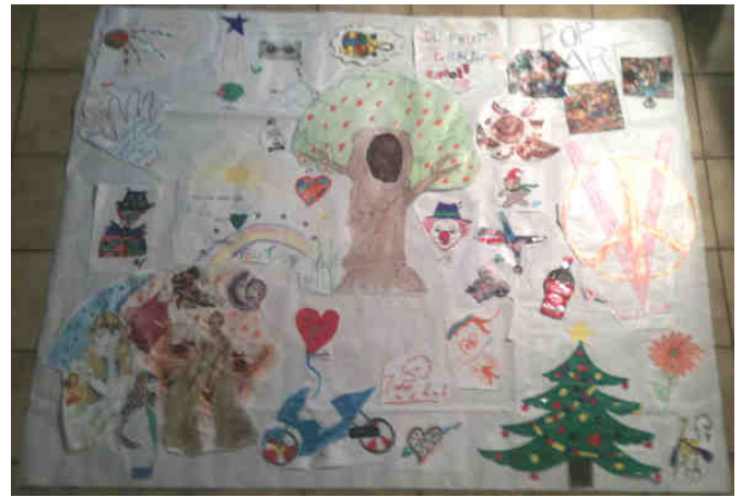
Fresque réalisée par les ados et mise en forme par les Art'elières.

Les Art'elières ont donc "déclenché un plan fresque" en urgence !!! Grand rouleau de papier