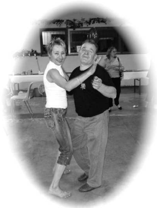
Le couple de l'année