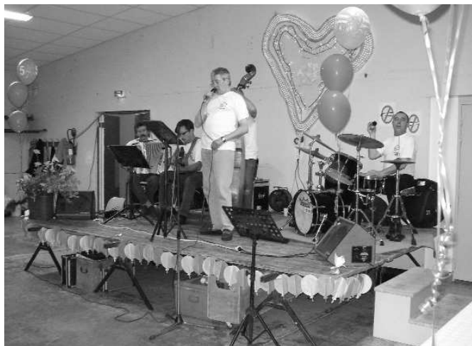
Les Bartavelles à Pibrac